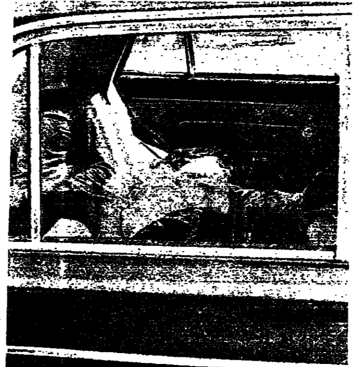
الخب القليل ملك ميشال ترة داخل السيارة في « عين الرمانه » امس

اعان في القاهرة وواشنطن امس ان الرئيس تور السادات والسويس الأمريكي نورد سيجتمعان في سالتورج بالتمس يومي ١ حزيران المقبل حالة «التسليم والتسليم» في الشرق الوسط . وكان الرئيس تور السادات قد اعان في خطاب القاه في اسبوع امس الاول ، ان مصر ستبدا تحركها ديبلوماسية جديدا ، الغاية منه انهاء حالة «التسليم والتسليم» في الشرق الوسط . ودعا الرئيس السادات الولايات المتحدة الى ان تملن موقفها ، وقال: أرد ان اتول الولايات المتحدة تسخ يجب ان تكون لديها سياسة محددة أزاء اسرائيل . وتود ان تكون هذه السياسة واضحة وحل قوي للولايات المتحدة حماية اسرائيل داخل حدودها او تمكثها من احتلال الأرض العربية . وأضاف يقول ان على اسرائيل ان - البقية على ص ١٤ عمود ٤ -